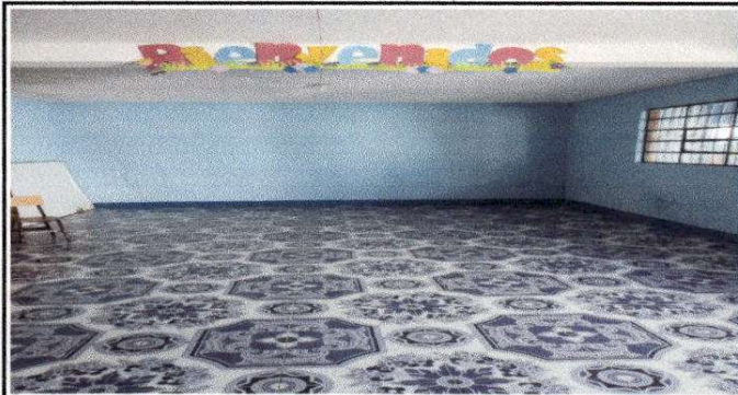
Foto 3. Pintado de 95 Metros cuadrados de pared en la parte interior de dos aulas del Nivel Primario.