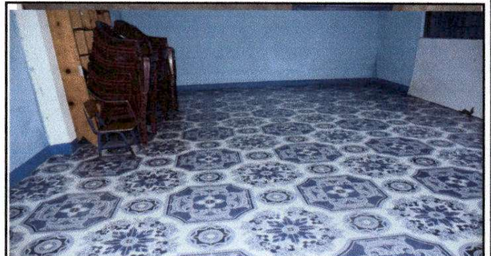
Foto 4. Pegado de 35 Metros cuadrados de piso cerámico, por sustitución de piso de torta de cemento en un aula del Nivel Primario.