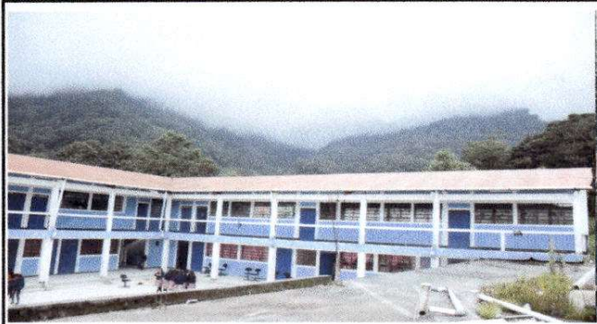
Foto 1. Pintado de 525 Metros cuadrados de techo de lamina, del establecimiento.