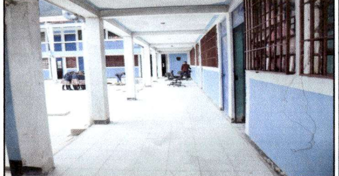
Foto 2. Pintado de 110 Metros cuadrados de piso de granito, por la sustitución de piso de torta de cemento, en los corredores del establecimiento.