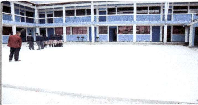
Foto 5. Reparación de 225 Metros cuadrados de plancha de concreto en el patio del establecimiento.